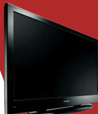
REGZA SÉRIE LV675

Les téléviseurs REGZA de la série LV675 (81 cm ou 102 cm) ne passeront pas inaperçus sous le sapin. Ils offrent en effet, un écran de grande taille susceptible de réunir toute la famille pour partager des instants sous le signe de la Haute Définition. Ultra performants grâce au processeur Meta Brain, ils transforment tout type d'image SD ou HD en qualité haute définition (technologie Résolution +). Enfin, pour s'adapter aux envies de chacun, ils sont équipés d'un tuner TNT HD intégré et se fondent dans tous les types d'intérieurs grâce à leur design sobre et à leur finition laquée noire.