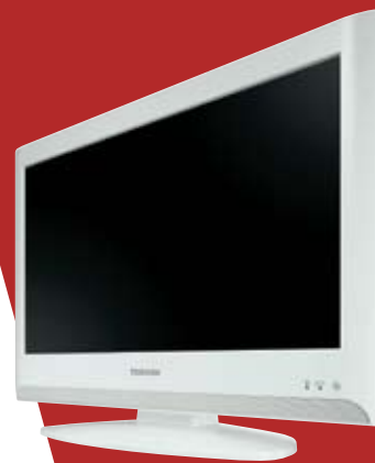
LCD SÉRIE AV625