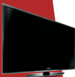
REGZA SÉRIE SV675

L'alliance parfaite du design et de l'innovation pour une qualité d'image à couper le souffle!